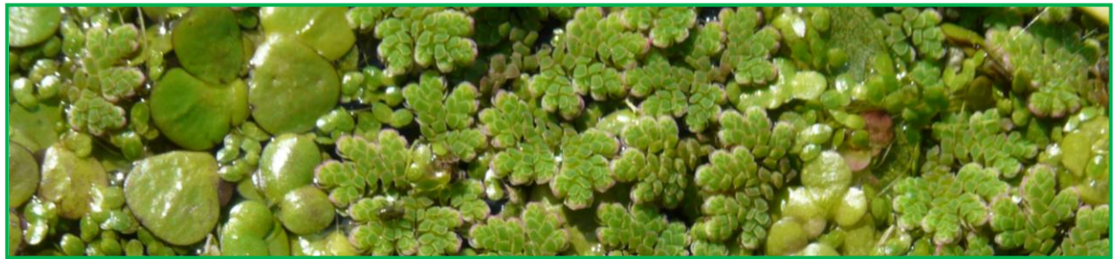
Veelwortelig kroos, klein kroos (eendenkroos) en kroosvaren (azolla )